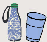
Gourde ou ecocup